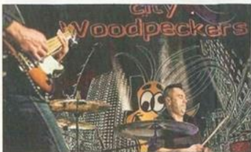
City Woodpeckers étaient en concert vendredi soir.