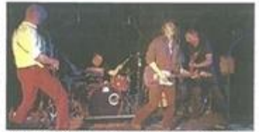
Les City Woodpeckers remonteront sur scène vingt ans après leur premier passage salle du Quai, avec les groupes The Fairy Ladies et X-TV.

Les musiciens du pays viennent ont leur soirée. Depuis l'année dernière, la MJC souhaite mettre en avant les talents locaux par le biais de soirées-concerts qui leur sont réservées. Après une première édition réussie, place au second volet de cette initiative originale avec une nouvelle soirée qui regroupera trois formations locales vendredi soir à la salle du Quai. Pour cette deuxième soirée "Support Your Local Scene", ce sont trois générations de fans de rock'n'roll qui seront à l'honneur !