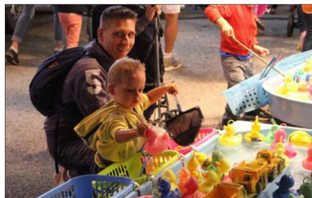
La fête foraine, ce n'est pas que des manèges : les stands de jeux d'adresse et de friandises sont également à Embrun.