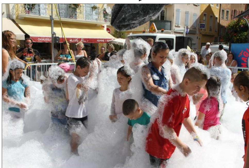
Cette folle après-midi "mousse", en une chaude journée, a apporté de la fraîcheur aux enfants, aux ados et même à leurs parents.

Les Grandes fêtes d'été d'Embrun, avec chaque jour de nouvelles animations et la fête foraine au pied de ville, se prolongent jusqu'à demain.