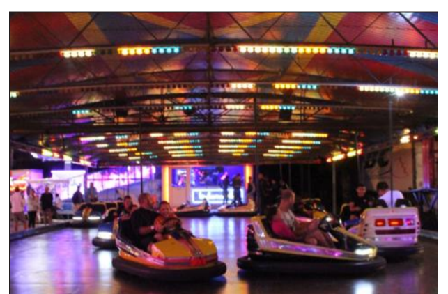
Les auto-tamponneuses, grand classique des fêtes foraines.