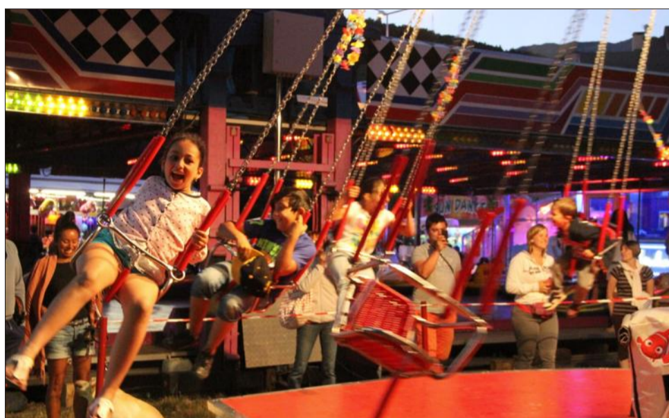
Balancoires ou hélicoptère : auprès des enfants, les manèges ont toujours autant la cote ! Les sourires sur leurs visages sont là pour le rappeler.

Parmi les attractions : la fête foraine, sur l'esplanade de la Résistance. Ses manèges ainsi que ses stands de friandises et de jeux sont à Embrun jusqu'à demain. Beaucoup d'enfants (et d'adultes) en ont déjà profité ; pour les autres, il ne reste plus que trois jours pour arpenter ces amusantes allées.