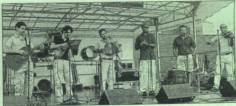
● Le groupe Sacrée Bordée animera la 20 e fête de l'huître en régaland le public avec ses chants de marins.

« Il ne reste plus qu'à espérer que le soleil sera de la fête », disent les organisateurs, « Tout le monde est prêt et nous avons des dizaines de bénévoles prêts à retrouver leurs manches ». Après la messe célébrée en l'église Saint-Pierre, comme de coutume, le cortège se mettra en place pour se rendre en musique du bourg à Balvras. Cette année, c'est le cercle celtique Bugale Melrand qui animera la fête. Nouveauté également, avec la participation du groupe arradonnais Sax o'fun, qui se joindra à la