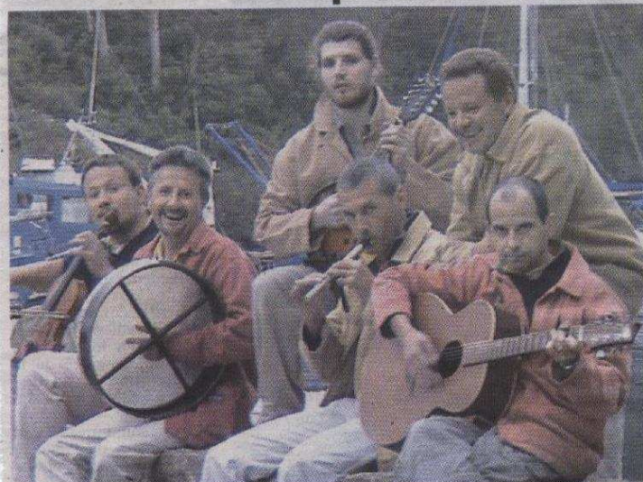
Sacrée Bordée apportera un air du large.

Plumelec accueillera le public du Tour de France par un spectacle en plein air