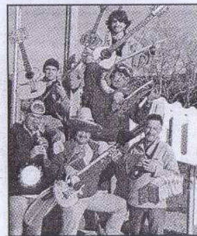
Le groupe Sacrée Bordée va vous faire revivre le vrai chant de marin !

Pratique : samedi 12 juillet, au terrain des sports de St-Clet, à partir de 19 h 30 : repas champêtre (4 € enfant/8 € adultes) suivi d'une soirée dansante avec chants de marin et sonneurs du bagad. Pommerit-le-Vicomte ainsi qu'un feu d'artifice (entrée gratuite).