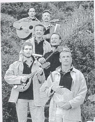
Sacrée Bordée dans sa composition actuelle.

Sacrée Bordée sera de la fête à Port-Anna